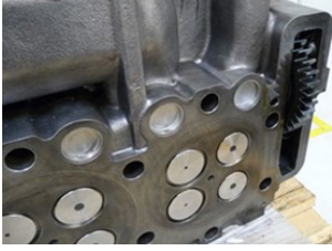
Düz dişli çarklı silindir başlığı conta yüzeyi

Vana kontrol biriminin düz dişli çarklar ile silindir başlığına ve motor bloğuna konstrüktif yerleşiminden dolayı (bakınız resimler), makine ile işlenen conta yüzeylerinden alınan malzemenin, uygun kalınlıktaki bir silindir başlığı contası ile dengelenmesi gerekmektedir.