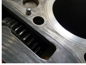
Düz dişli çarklı motor bloğu conta yüzeyleri

Standart conta (kalınlık: 1,2 mm; Elring 021.262; 357.831) bunun için öngörülmemiştir. Aksi takdirde dişli çarkları diş kenarları birbirinin içine girer. Bu da hızlı aşınmaya ve hasara neden olabilir. Elring, motorun sürekli ve çevreye uygun bir şekilde tamir edilebilmesi için 0,3 mm daha kalın olan bir silindir başlığı contası geliştirdi. Bu conta, çıkarılan malzemeleri dengeliyor.